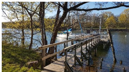
Låda vid mast innan byte.

Under segelsäsongen 2017, väcktes tanken att byta ut våra konventionella batterier till något modernare. Vi har haft batterier lite utspritt i båten, under förpiken, i lådan bredvid masten samt i lådan under lejdaren, kablar som gått kors o tvärs för att kunna ladda allt, med olika brytare för att kunna separera olika förbrukare etc.